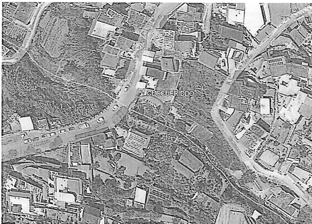
Figura 1. ortofoto del sito

Il muro di che trattasi è un muro a gravità in pietra locale; la parte crollata ha una lunghezza di circa 15 metri e un’altezza di circa 15; in sezione presenta un terrazzamento intermedio, a quota relativa 3.00 m, per poi riprendere in salita. Il muro rappresenta un contenimento, contrastando con il solo proprio peso la spinta del terreno retrostante.