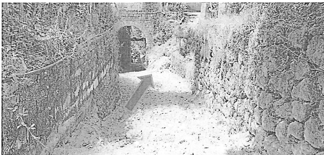
Figura 2: dove deve venire l'opera

della spesa mediante atti contabili. Per tali attività è previsto un compenso lordo di euro 9.000,00 (novemila,00) oltre IVA e Cassa, così come specificato nella parcella allegata;